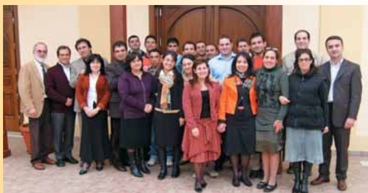
Alcuni degli studenti della scuola succursale - Palmi