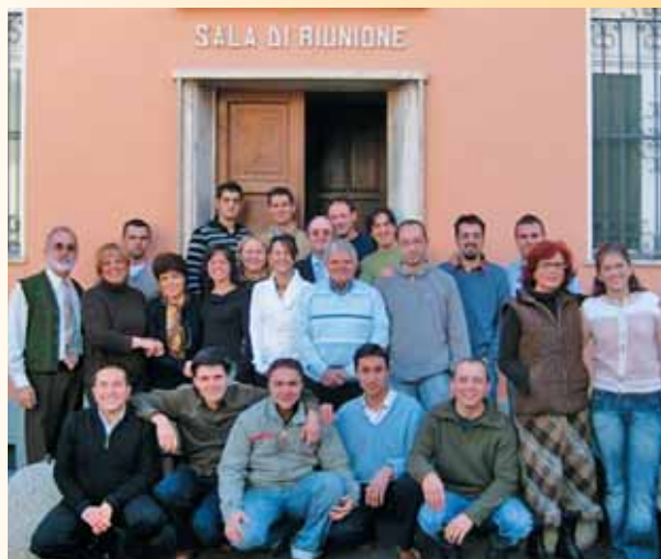
Alcuni degli studenti della scuola succursale di Asti

Sta per iniziare una Scuola Succursale a Casoria (Napoli).