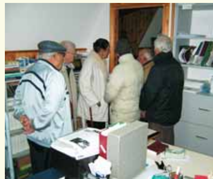
Anziani in visita all'IBEI

Altri studenti, sempre del secondo anno, sono stati impegnati in vari progetti di ministero a carattere pratico a medio o lungo termine, a seconda dei loro doni, presso alcune chiese della capitale o dell'immediata vicinanza all'Istituto. Sentiremo da loro nel prossimo numero di INFORMAZIONE. Qui citiamo il bel lavoro svolto con gli anziani di una Casa di Riposo e quello con il bel gruppo di adolescenti al Laurentino.