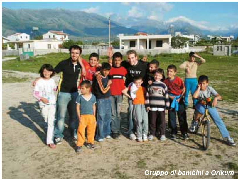
Gruppo di bambini a Orikum