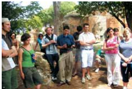
Lezione all'aperto a Ostia Antica

"Sono stati un viaggio e una permanenza bellissimi. Sono molto grato a tutti voi dell'IBEI per aver organizzato questo periodo. Le lezioni dei tre insegnanti mi hanno illuminato su Israele, su diversi elementi della storia e della religione italiane, sulla realtà del cattolicesimo contemporaneo. Ho gioito tutti i momenti di comunione con gli studenti: è stato bello anche quando non sempre siamo riusciti a capirci subito!