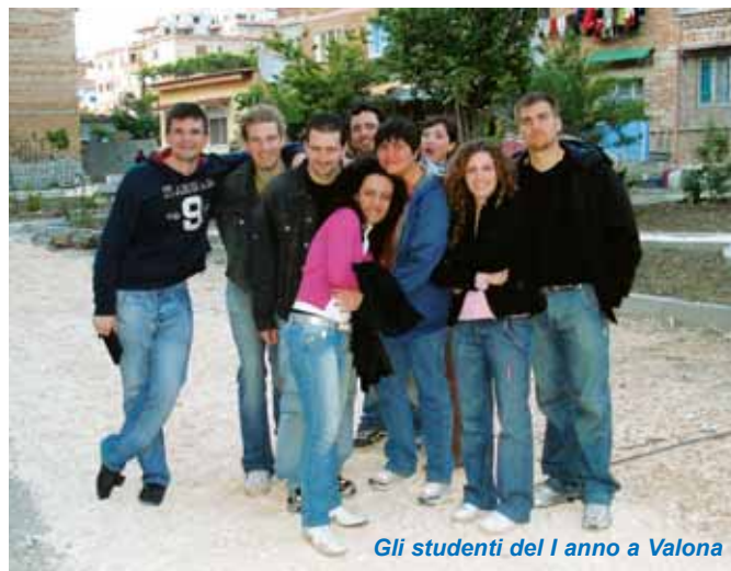
Gli studenti del I anno a Valona

Ovunque e sempre, a livello evangelistico come d'insegnamento, la Scrittura ha avuto una parte preponderante. La predicazione dell'apostolo Pie-