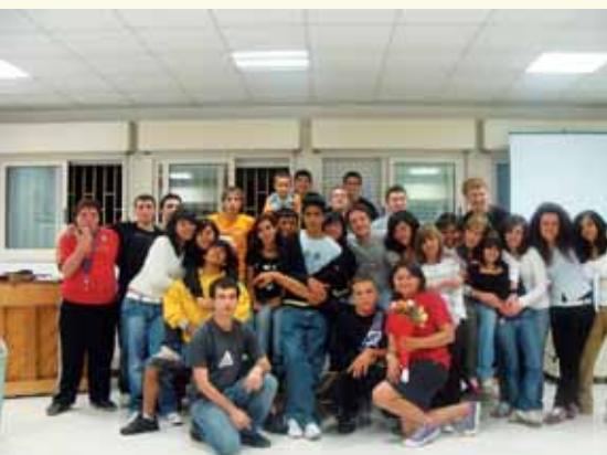
Il gruppo di adolescenti curato dai nostri studenti

Lavorando e servendo la chiesa mi sono reso conto, ancora di più, dei miei limiti e delle mie paure, mi sono sentito imprepa-