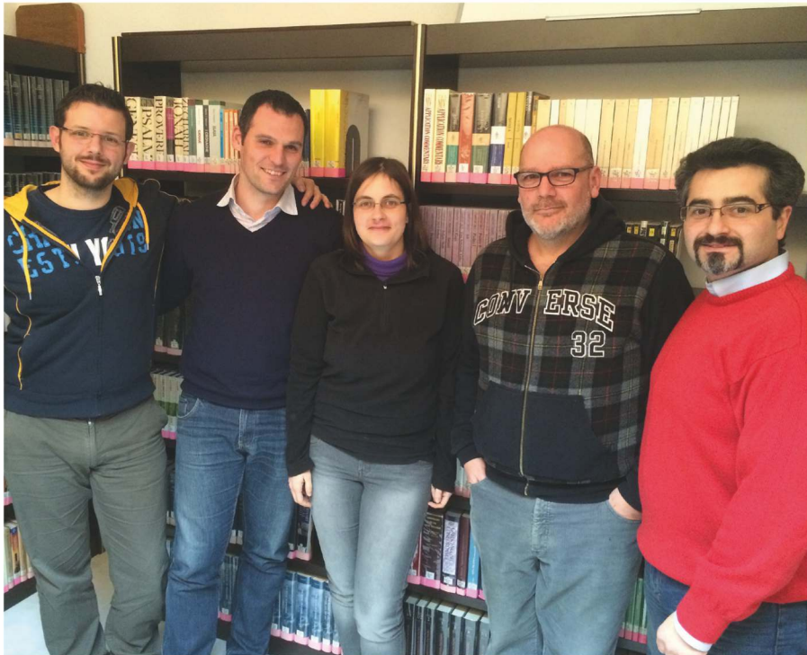
Nella foto, cinque nostri ex studenti che, oltre a dare un contributo fattivo alle loro chiese locali, sono impegnati nell'opera e, da qualche anno, sono nostri insegnanti.

Dopo mesi di preghiera e lavoro di preparazione, siamo grati al Signore e felici di poter annunciare che la Scuola residenziale, dopo quattro anni di interruzione, riprenderà le sue attività didattiche nel mese di settembre 2016!